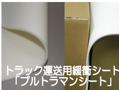
トラック運送用緩衝シート 「プルトラマンシート」

注：上記以外の厚み・サイズもお気軽にお問い合わせください。 運賃は別途頂戴いたします。小倉工場現地受け渡し可能！