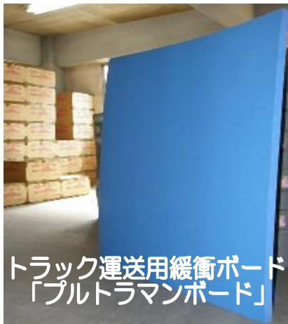
トラック運送用緩衝ボード 「プルトラマンボード」